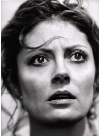
Bild/Foto in schwarz-weiss umwandeln

Verpflegung Selbstverpflegung für jene, die zwischendurch eine Pause brauchen. In der voll eingerichteten Küche in Schötz hat es so ziemlich alles zur Verfügung, was das Herz begehrt. Mikrowelle, Kaffeemaschine, Wasserkocher und Tee/Kaffee vorhanden.