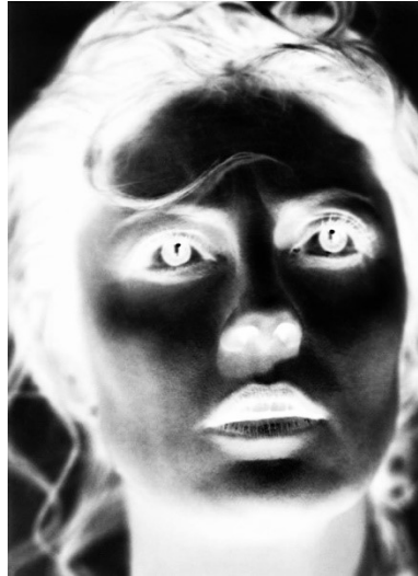
Ev. umkehren, Kontrast erhöhen