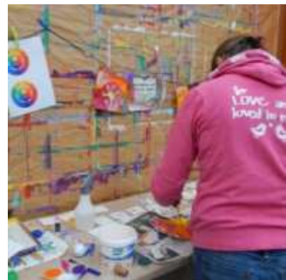
Impressionen vom März `17